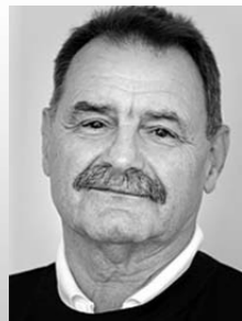
Uwe Hofner Lithograph